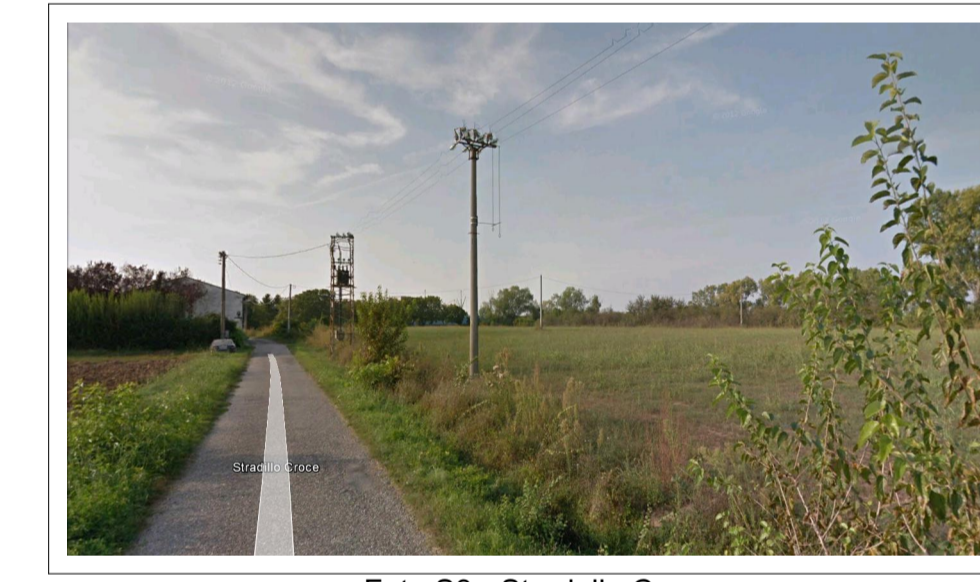
Foto S3 - Stradello Croce