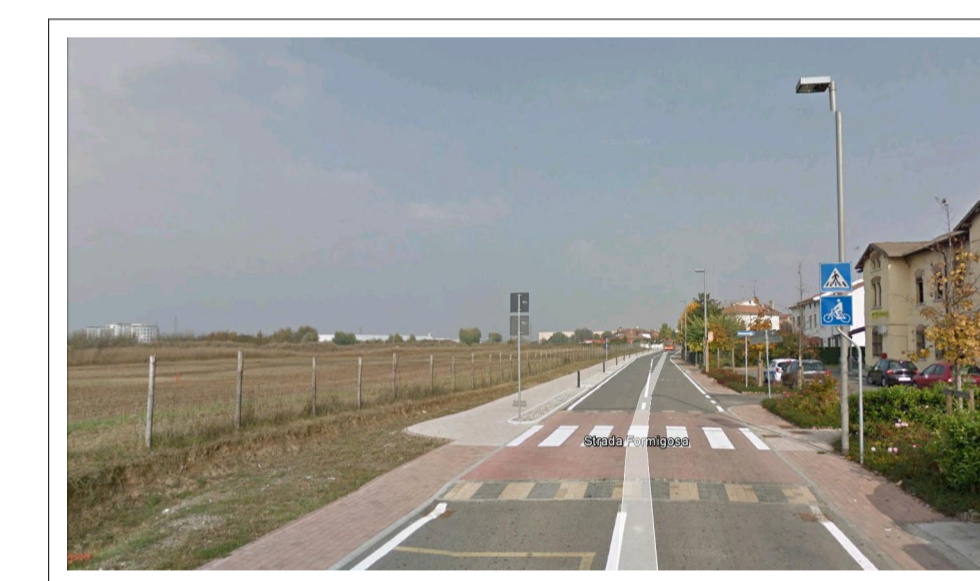
Foto S1 - Strada Formigosa