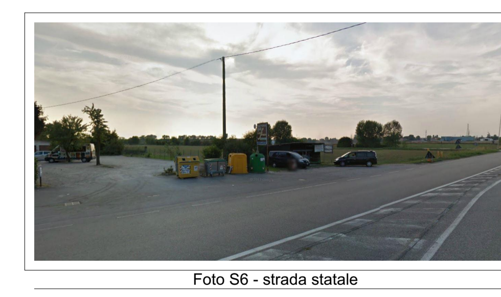
Foto S6 - strada statale