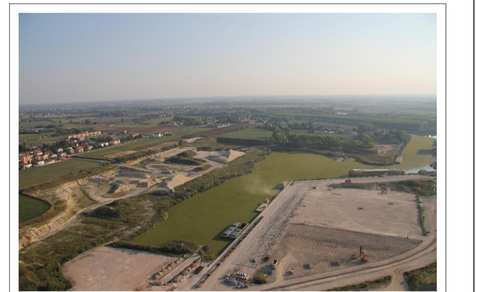
Foto aerea - A1