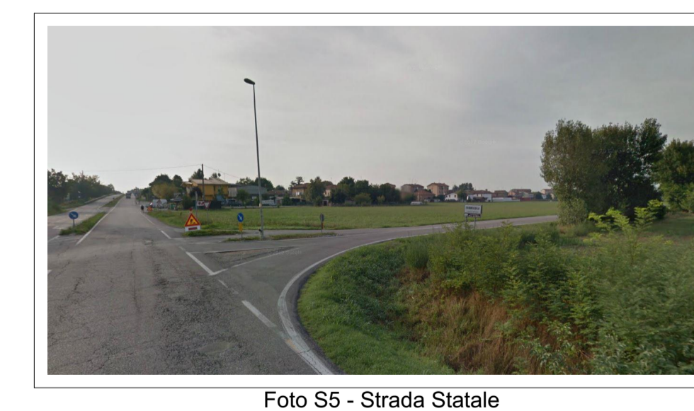
Foto S5 - Strada Statale