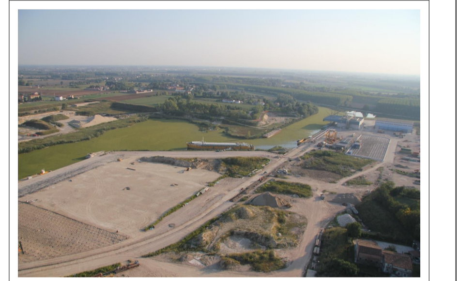
Foto aerea - A4