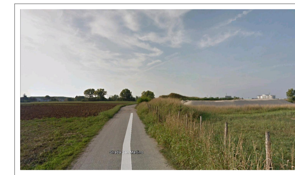
Foto S2 - Strada S. Martino