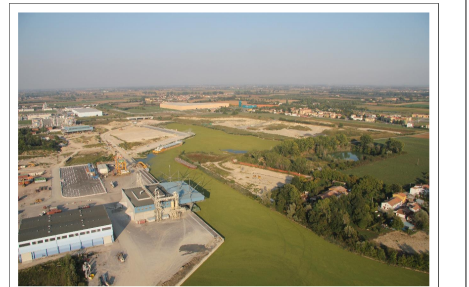
Foto aerea - A2