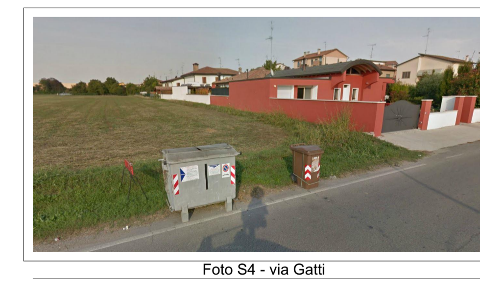
Foto S4 - via Gatti