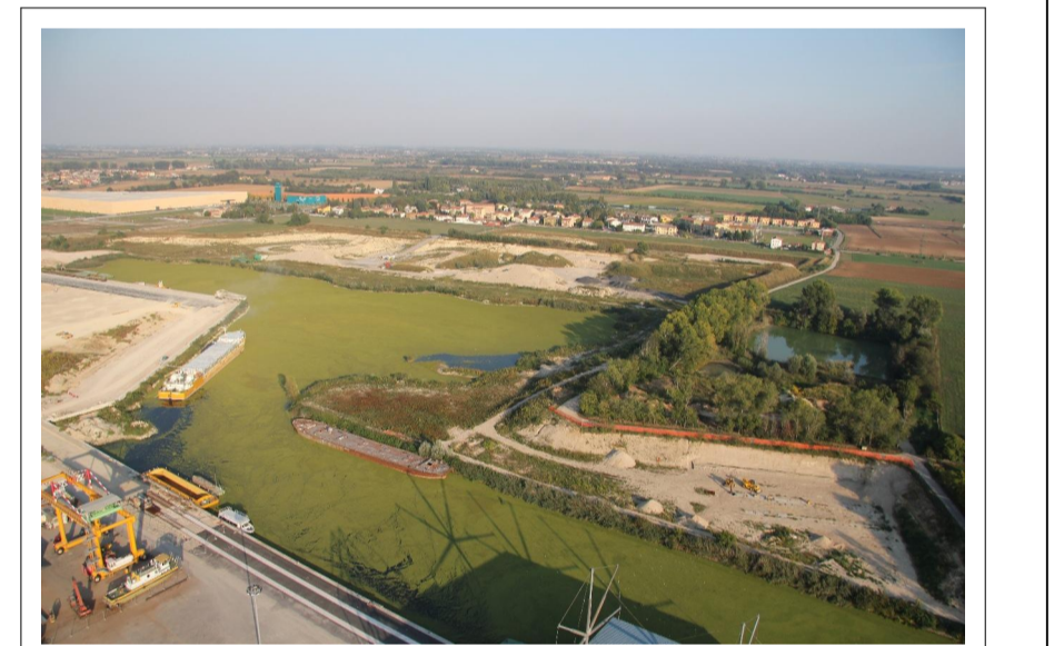
Foto aerea - A3