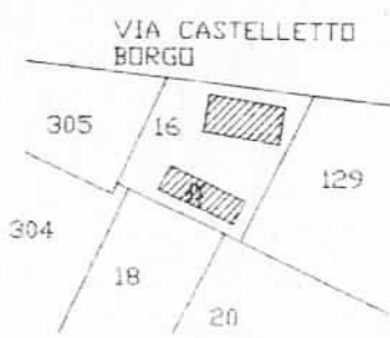
PLANIMETRIA GENERALE SCALA 1:2000 FG. 76 MAPP. 16-17