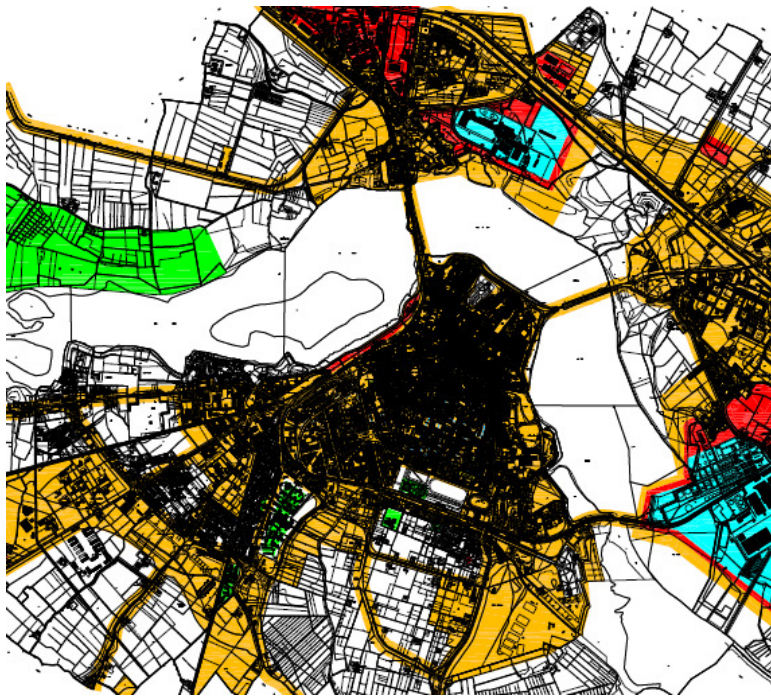
Fig. 3 Estratto Piano di Zonizzazione acustica