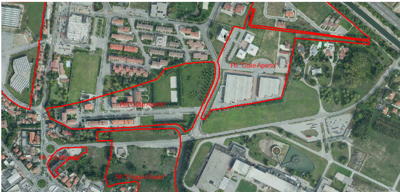
Foto aerea con individuazione dei comparti

Il programma integrato di Colle Aperto, è stato realizzato in forza dell’Accordo di programma tra Regione Lombardia e Comune di Mantova, approvato con D.P.G.R. 29/09/1999 n. 41163, modificato con D.P.G.R. 23/06/2003 n. 10239 e con verbale del Collegio di Vigilanza del 26.06.2006. Con verbale del Collegio di Vigilanza del 27/11/2012 è stato dichiarato concluso l’accordo di programma, in quanto sono state raggiunte le finalità di interesse pubblico.