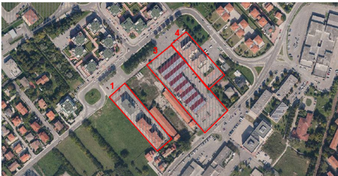
Foto aerea con individuazione dei comparti

Il piano attuativo (comparti 1, 3 e 4) è stato approvato con D.C.C. 33 del 09.05.2003 e ha visto la realizzazione di tutte le opere di urbanizzazione. Il Comparto 1 è a destinazione prevalentemente residenziale, il Comparto 3 è a destinazione d'uso commerciale, e il Comparto 4 è a destinazione d'uso commerciale e residenziale.