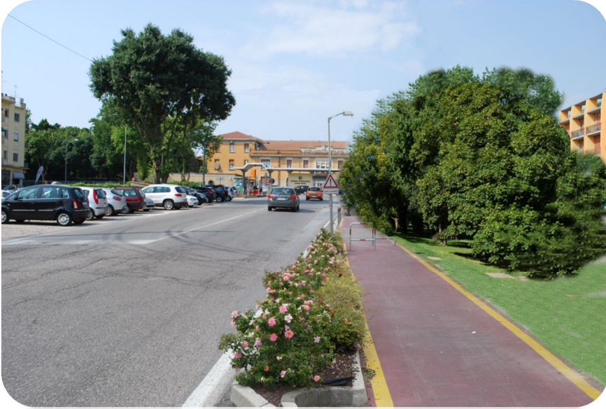
Ipotesi di ciclopedonale su viale Oslavia